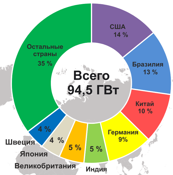
IRENA Renewable Energy Capacity Statistics 2015