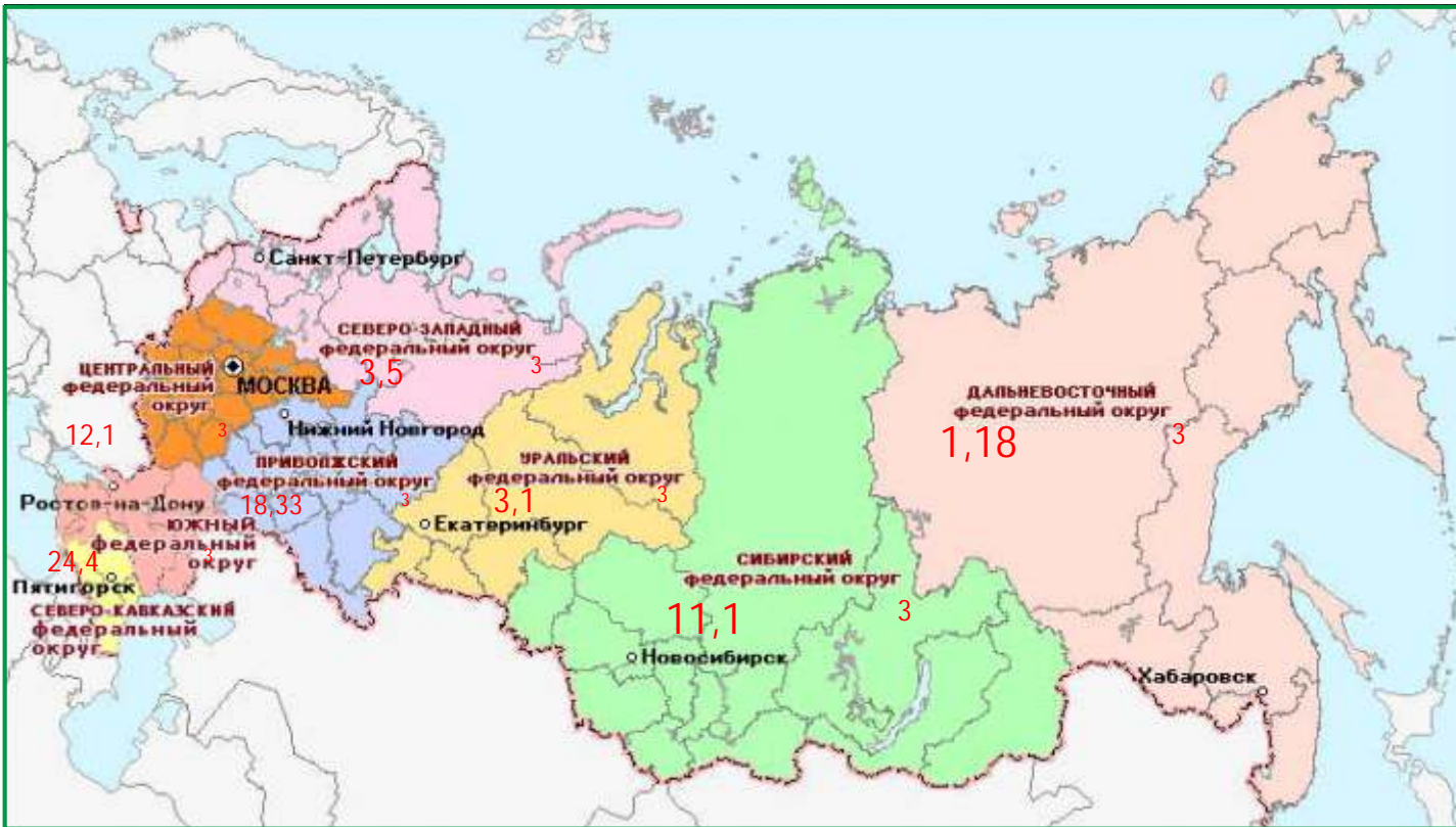
* XXI , , 2012 .